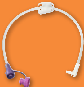
0328-12 ENFit (30 cm) 0328-24 ENFit (60 cm)