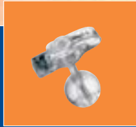
MediLime Tummy Button