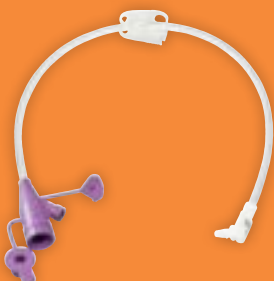
0321-12 Y-stuk Bolus Luer (30cm) 0321-24 Y-stuk Bolus Luer (60cm)