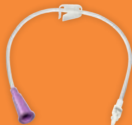
0323-12 Bolus (30 cm)